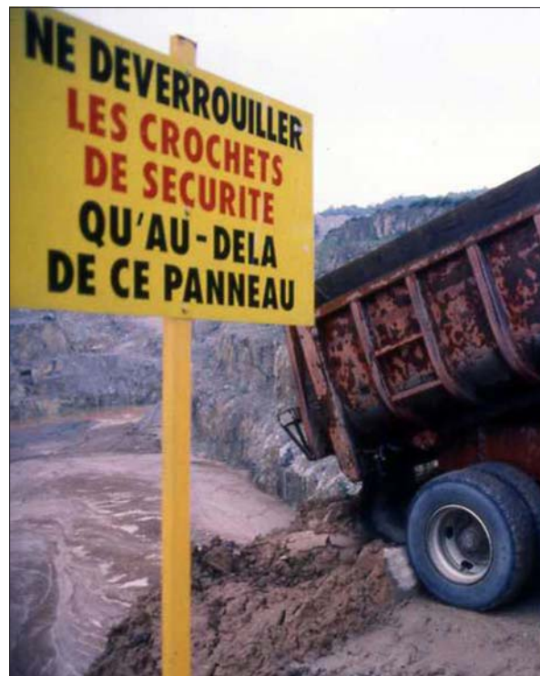
Kuva 4. Lietteen siirto lietealtaaseen

Useat radioaktiiviset aineet ovat myös muuten myrkyllisiä. Radioaktiivinen lyijy, jota vapautuu uraaninlouhinnassa radonkaasun tytärtuotteena, on ominaisuuksiltaan yhtä vaarallista kuin tavallinen lyijy (joka aiheuttaa neurologisia oireita, jopa aivovaurioita). Plutonium ja radium (kalsiumin sukulainen) kerääntyvät luustoon, plutonium luun ulkopinnalle ja radium tasaisesti luuhun, mikä aiheuttaa mahdollisesti luusyöpää (osteosarkooma).