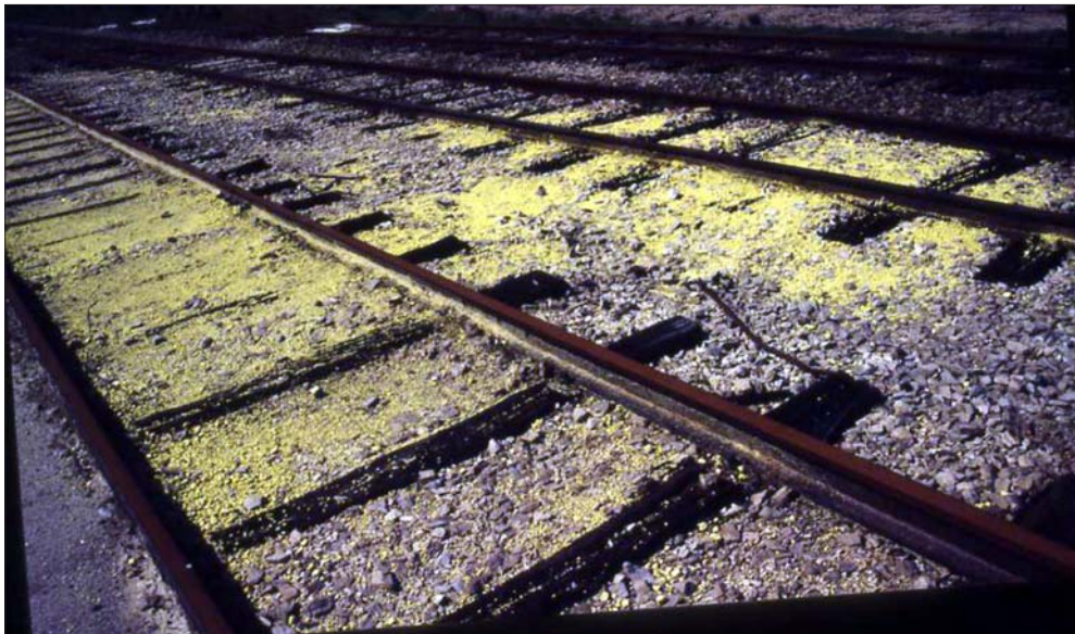
Kuva 13. Yellowcaken (uraanirikasteen) jäännöksiä rataisikoilla