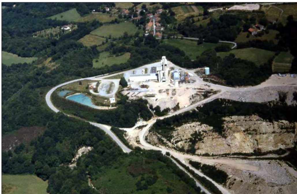
Kuva 8. Uraanikaivosaluetta

Ydinvoimalaitoksen vuoden mittaisesta normaalikäytöstä väestön yksilölle aiheutuvan