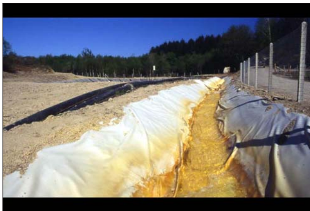
Kuva 5. Kaivoksessa käytetyn veden juoksutus

Uraani on radioaktiivinen alkuaine, jota esiintyy kaikkialla maankuorella sekä pohja- ja pintavesissä. Yhdessä kuutiometrissä kiveä on noin 2,5–10 grammaa uraania. Uraania tuotavilla kaivosalueilla uraanin pitoisuudet ovat muutamien prosenttien luokkaa. Uraani voi olla kaivoksissa päämetallina tai esiintyä oheismetallina jonkin muun metallin (nikkeli, kulta, kupari, koboltti, arseeni) kanssa. Monimetalliesiintymisessä uraanin hyödyntäminen on taloudellisesti kannattavaa vielä noin 100 miljoonasosan pitoisuuksina tai pienempinäkin.