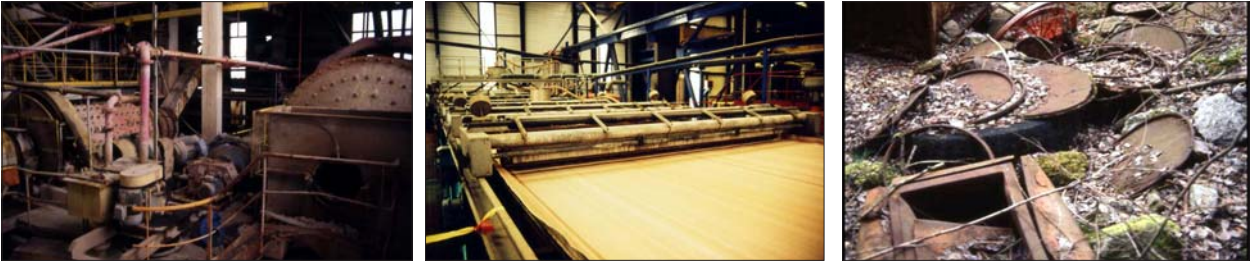
Kuva 9-11. Malminkäsittelylaitos ja kaivoksen radioaktiivista metalliromua

Säteilylle asetetut ohjearvot sallivat hyvin korkean vakavien terveystahojen, kuten syövän, riskin verrattuna esim. vaarallisten kemikaalien ohjearvoihin. Lisäksi esim. lasten ja sairaiden kohdalla riskit ovat koko väestön keskiarvoa suuremmat. Henkilökohtaisella tasolla ei ole merkitystä sillä, kuinka paljon haitallisia terveysvaikutuksia on väestötasolla. Riittää, jos omalle kohdalle sattuu niistä yksikin.