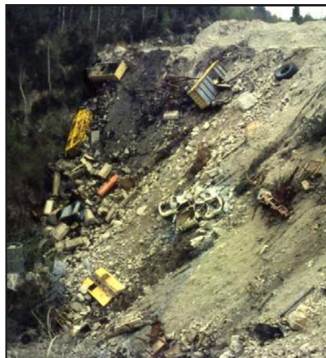
Kuva 7. Radioaktiivista rautaromua rinteessä

Juomaveden radon altistaa säteilylle lähinnä ruuansulatuskanavaa ja virtsateitä. Tarkkaa juodun radonin aiheuttamaa syöpäriskin suuruutta ei tiedetä. Säteilyturvakeskus sallii yksityistalouksille 1000 Bq/l radonia sisältävän porakaivoveden käytön. Jos kaikki suomalaiset käyttäisivät jatkuvasti porakaivovettä, jonka radonpitoisuus on 1000 Bq litrassa, aiheuttaisi juotu vesi 30–400 vuosittaista mahasyöpää. Veedestä huoneilmaan vapautunut hengitetty radon aiheuttaa vuosittain 100–600 keuhkasyöpää. Huoneilman radon saattaa olla yhteydessä myös leukemiaan. Erityisesti lasten leukemioita on yhdistetty korkeaan veden ja huoneilman radonpitoisuuteen.