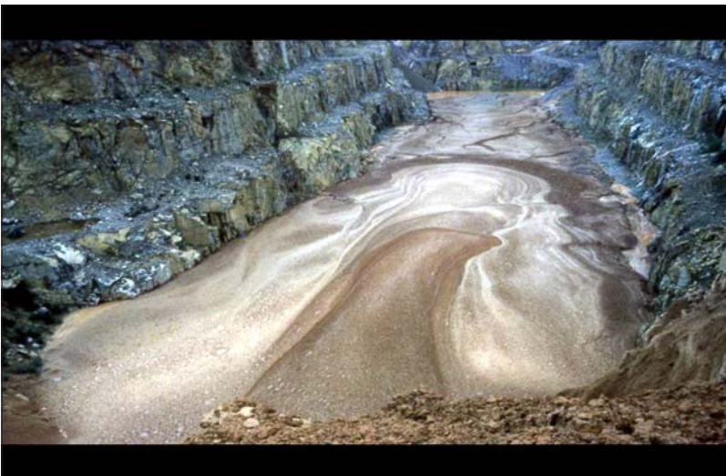
Kuva 6. Lieteallas

Kanadassa pintavesiin päästetään MacArthurjoen ja Key Laken kaivoksista vuosittain 12 miljoonaa kuutiota eriasteisesti käsiteltyjä jätevesiä. Malminrikastamolta tähteeksi jäävä hiekka ja liete tulee eristää ympäristöstä sadoiksi tuhansiksi vuosiksi. Halvin ratkaisu tähän on altaiden peittäminen vesikerroksella. Ongelmana vain on, että veden pintaa on mahdotonta pitää halutulla tasolla tuhansien vuosien ajan.