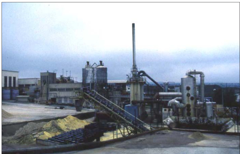
Kuva 3. Yellowcakea (uraanirikastetta) malminkäsittelylaitoksella

Kehon ulkopuoliset beetahiukkaset kykenevät aiheuttamaan suurina annoksina palovammoja ja muita ihovaurioita Pitkäaikainen altistus aiheuttaa mm. ihosyöpää. Beetasäteilijöitä ovat esimerkiksi cesium-137, lyijy-210 ja torium-234.