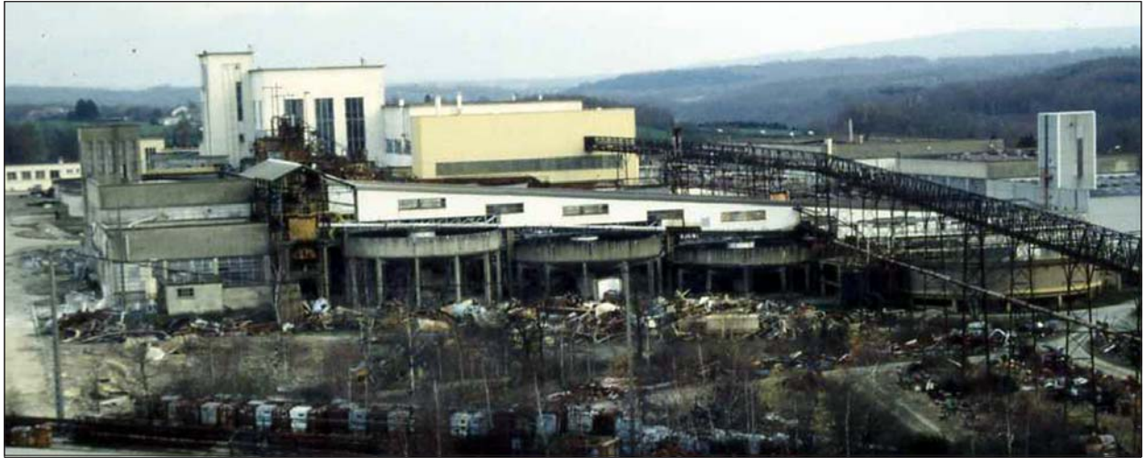
Kuva 1. Malminkäsittelylaitos - Limousin, Ranska