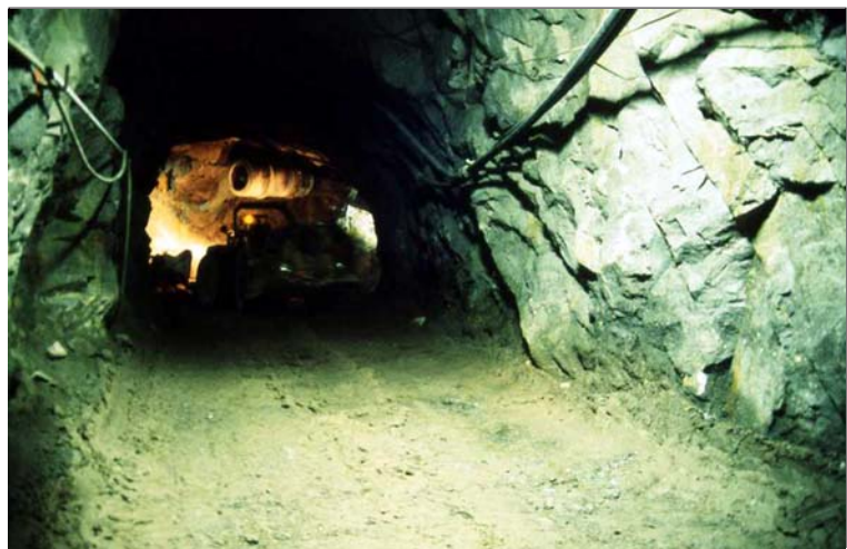
Kuva 12. Kaivostunneli

Terveydelliset vaikutukset eivät koske vain kaivostyöläisiä vaan myös ihmisiä, jotka asuvat kaivoksen ympärillä. Uraaninlouhinnassa vapautuvan pölyn ja jätevesien kautta pääsee myrkyllisiä aineita uraanikaivoksen ympäristöön ja joutuu siten ihmisiin, eläimiin ja kasveihin. Uraanin erottamisessa syntyvät tuotteet kuten lyijy ja radon, mutta myös prosessissa käytetyt hapot joutuvat ympäristöön leviten jokien ja pohjaviesien kautta laajoille alueille.